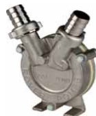
MATERIJAL : INOX