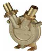
MATERIJAL : BRONCA