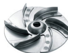
VORTEX ROTOR ANTIBLOCKING SYSTEM