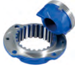
Radialni sjekač & Ring sjekač