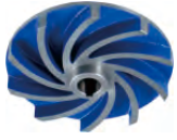
Anti block impeller