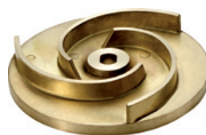
ROTOR PUMPE : TVRDA LEGURA MESINGA