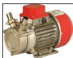
ELEKTRIČNA PUMPA NA 24 V DC